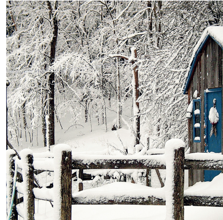
Chemin Gémont, Saint-Adolphe-d'Howard