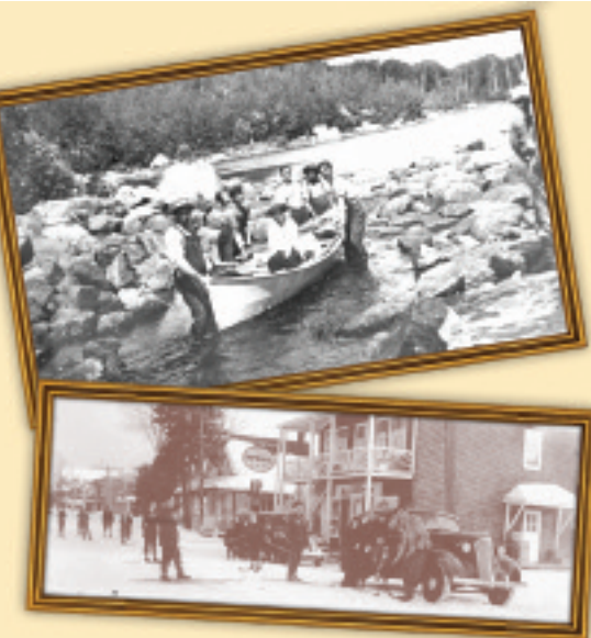
125 ans à illustrer (voir page 8)